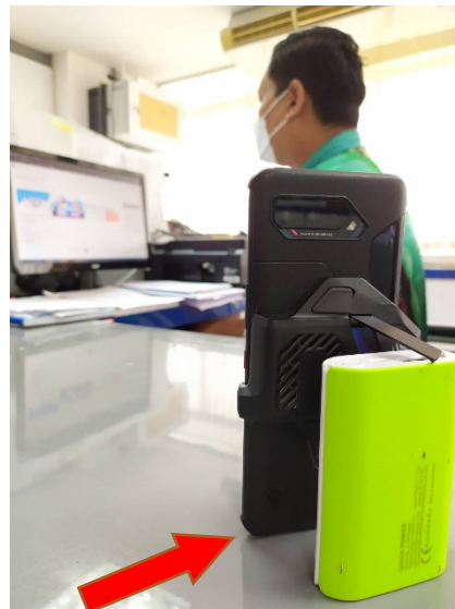
อุปกรณ์ชิ้นที่ 2 ใช้เปิดโปรแกรม ZOOM Cloud Meetings